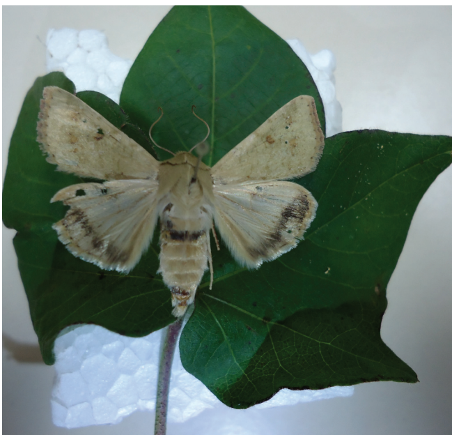
Figura 5. Adulto de Helicoverpa armigera .

comportamento de colonização de H. armigera (FIREMPONG; ZALUCKI, 1991). Cada fêmea, durante o período de oviposição, que é de cerca de 5,3 dias, pode colocar de 2.200 até 3.000 ovos sobre as plantas hospedeiras (NASERI et al., 2011; REED, 1965), o que caracteriza o elevado potencial reprodutivo desta espécie.