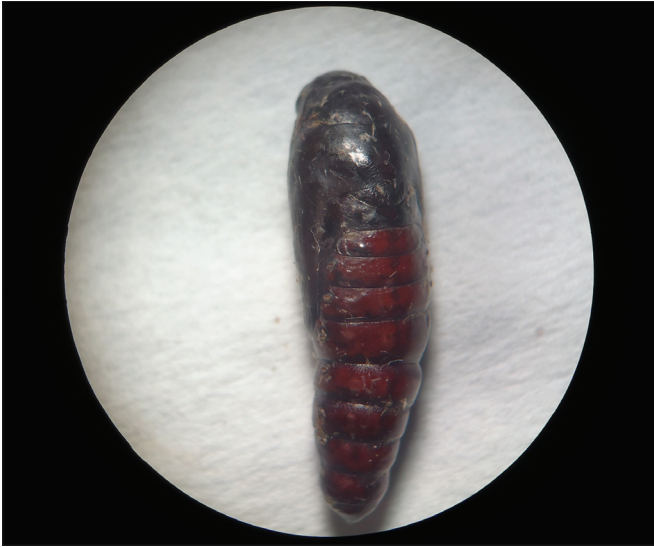
Figura 4. Pupa de Helicoverpa armigera .

As mariposas fêmeas de H. armigera apresentam as asas dianteiras amareladas, enquanto as dos machos são cinza-esverdeadas com uma banda ligeiramente mais escura no terço distal e uma pequena mancha escurecida no centro da asa, em formato de rim. As asas posteriores são mais claras, apresentando uma borda marrom na sua extremidade apical (Figura 5). As fêmeas apresentam longevidade média de 11,7 dias e os machos de 9,2 dias (ALI; CHOUDHURY, 2009). Os adultos de H. armigera são fortemente atraídos por flores que produzem néctar, sendo esse recurso importante na seleção do hospedeiro, o qual também influencia a sua capacidade de oviposição (CUNNINGHAM et al., 1999). Outros compostos secundários (semioquímicos) que são produzidos pelas plantas hospedeiras também influenciam o