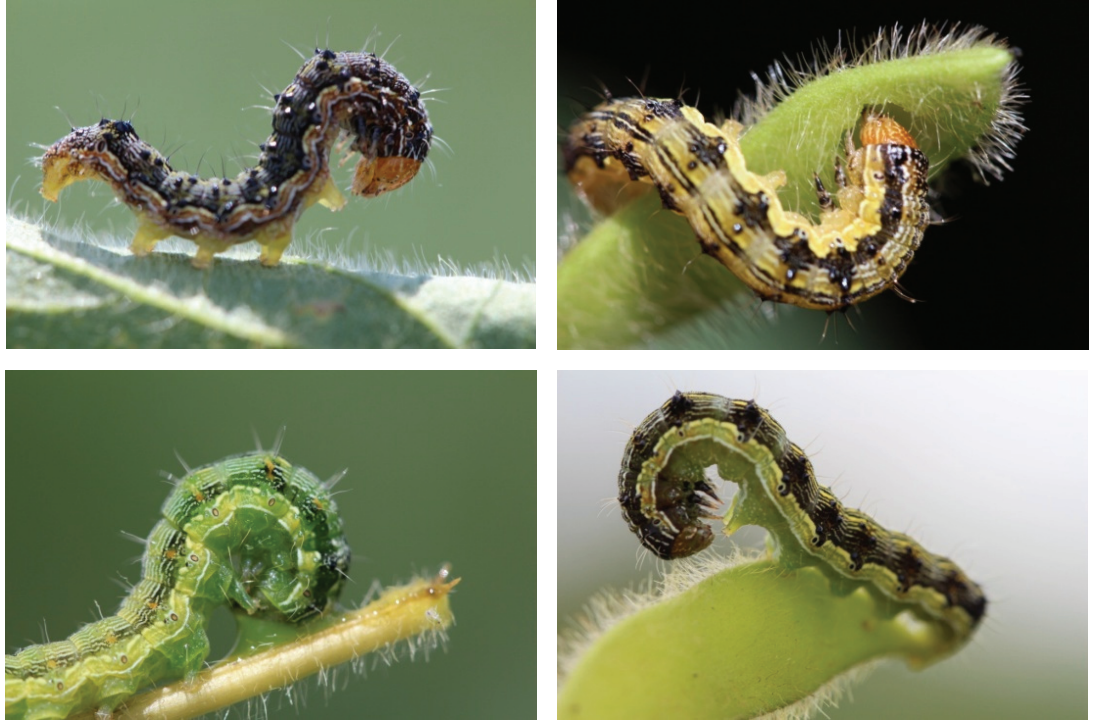
Figura 3. Lagartas de Helicoverpa armigera de diferentes colorações.

abdominais escuros e bem visíveis na região dorsal do primeiro segmento abdominal, os quais são dispostos na forma de semicírculo, aparentando formato de sela, sendo esta característica determinante para a identificação de lagartas de H. armigera (MATTHEWS, 1999). Outra característica detectável nas lagartas desta espécie diz respeito à textura do seu tegumento, que se apresenta com aspecto levemente coriáceo, diferindo das demais espécies de Heliiothinae que ocorrem no Brasil (CZEPAK et al., 2013b). Esta característica no tegumento da lagarta pode estar relacionada à capacidade de resistência que o inseto apresenta aos inseticidas químicos, especialmente para os produtos que têm ação de contato, como piretroides, organofosforados e carbamatos. Em adição, a lagarta